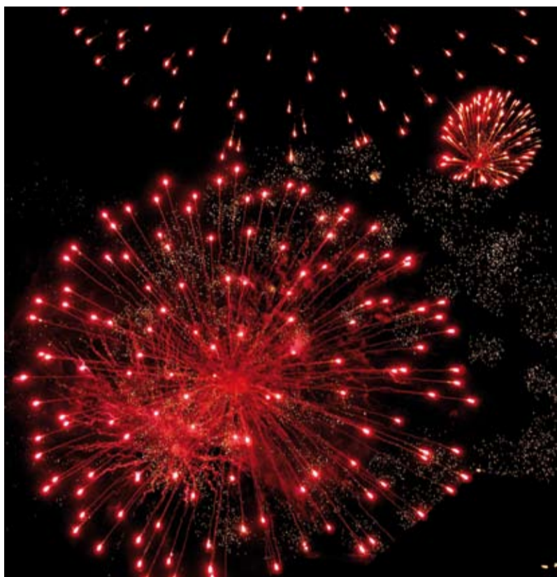
Zachwycający pokaz fajerwerków nad Cieszynem.