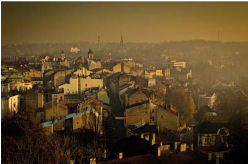
IV miejsce