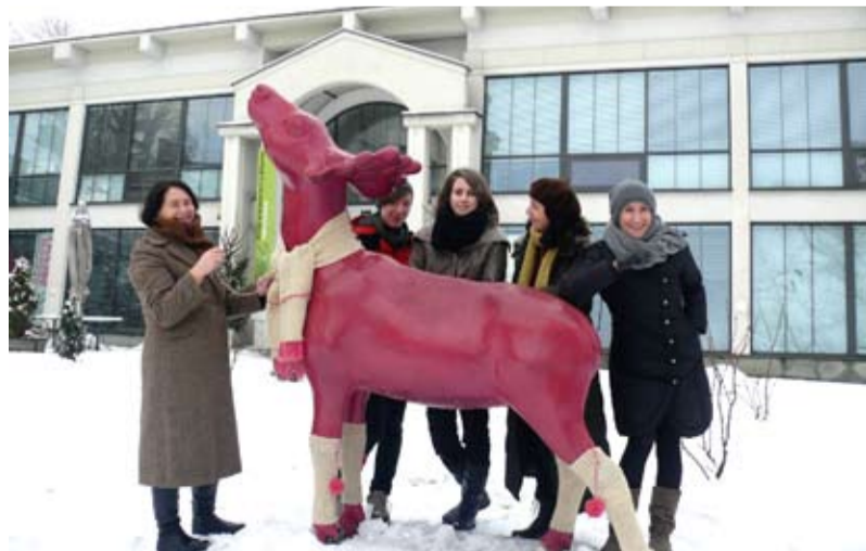
Finał akcji: Ubierz jelonka na zimę.