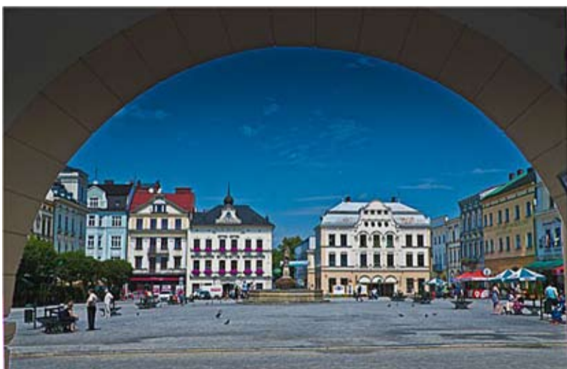
VI miejsce, fot. Andrew Squires