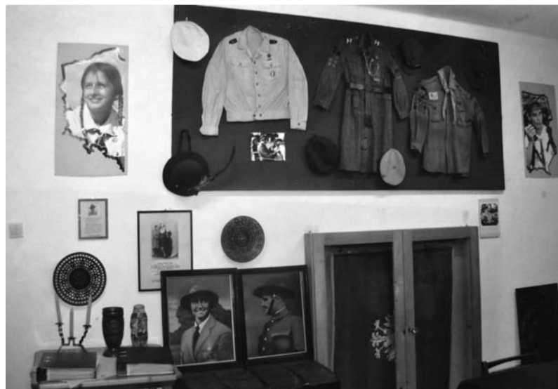
Ekspozycja w Harcerskiej Izbie Tradycji.

Zespół Promocji i Informacji Hufca ZHP Ziemi Cieszyńskiej