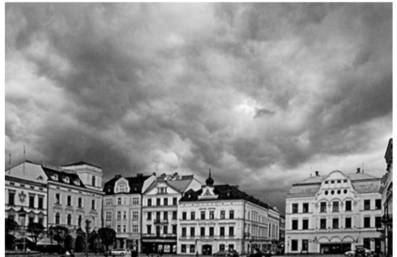
V miejsce, fot. Andrew Squires