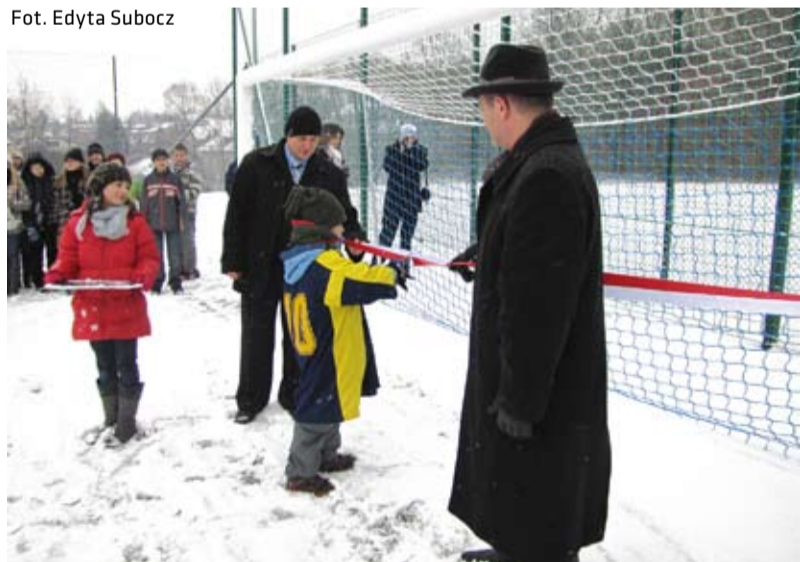
Uroczystego otwarcia Orlika dokonał uczeń SP 6 w towarzystwie Burmistrza Mieczysława Szczurka

21 grudnia 2011 r. w zimowej aurze Burmistrz Miasta Cieszyna Mieczysław Szczurek wraz z zaproszonymi gośćmi uczestniczył w otwarciu kolejnego boiska wielofunkcyjnego Orlik usytuowanego przy Szkole Podstawowej Nr 6 w Cieszynie.