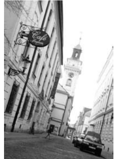
II miejsce