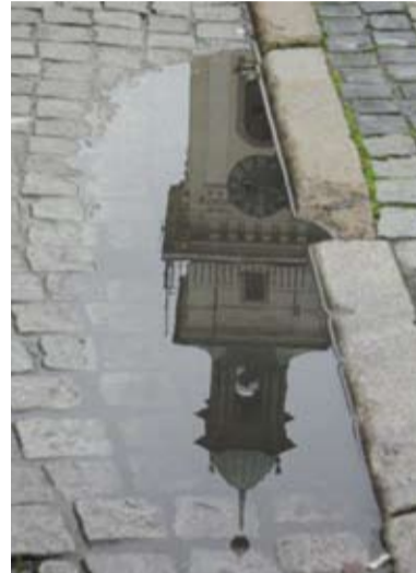
III Miejsce, fot. Maria Wrożyna