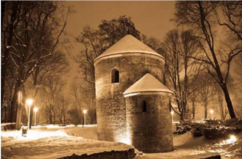
I miejsce, fot. Sławomir Piprek

czyli najlepsze prace zgłoszone do konkursu fotograficznego, o którym piszemy na pierwszej stronie