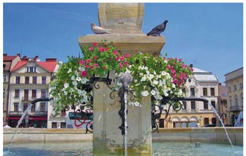
VII miejsce, fot. Andrew Squires

Zapraszamy Czytelników do współredagowania tej kolumny. Prosimy o nadsyłanie ciekawostek związanych z Cieszynem (np. anegdot, przepisów kulinarnych, zdjęć, dokumentów, wzorów rękodzieła artystycznego itp.), które mogłyby zainteresować innych i wzbogacić wiedzę o naszym mieście. Gwarantujemy zwrot wszystkich otrzymanych materiałów.